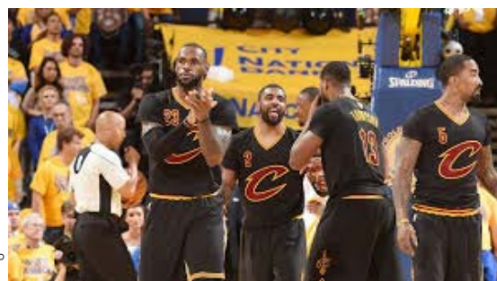
圖二 NBA 籃球隊 克里夫蘭騎士隊 (Steve Aschburner, 2016)

美國國家籃球協會(National Basketball Association) ，縮寫為 NBA 是 北美的職業籃球組織 ，擁有30支球隊，分屬兩個分區(Conference)： 東區 和 西區 「中文維基百科，NBA，2016」；每個聯盟各由三個分組(Division)組成，每個分組有五支球隊。30支球隊當中有29支位於 美國 ，只有一支來自 加拿大的多倫多 。一般直接稱作 NBA 、 美國籃球聯賽 或 美國職業籃球聯賽 (簡稱「 美職籃 」)。