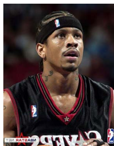
圖五 阿倫·艾弗森 Allen Iverson

經濟利益的趨勢也使得球員們更加關注個人的資料、個人的進攻和個人的防守，這與歐洲的分享籃球的觀念不太一樣。所以說，很難判斷誰比誰優秀多少。五名歐洲球員在場上能做任何形式的防守。