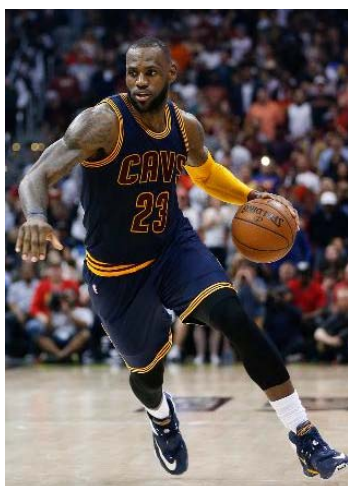
圖三 勒布朗·詹姆斯 Lebron-James (Forbe , 2016)