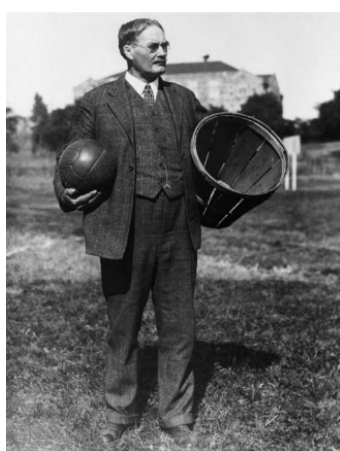
圖一 發明籃球的 詹姆士·奈史密斯 James Naismith (Pinterest The world's catalog of ideas)

1891年12月21日，籃球運動由 美國麻塞諸塞州春田市基督教青年會學校 (又說於 加拿大發明 ) (現今 春田學院 )體育教師 詹姆士·奈史密斯 (James Naismith)博士所發明。當時進行的方式是投擲至裝放桃子水果的籃子為目標，因此取名為籃球。起初最開始的籃球運動所使用的球類是足球，直至1950年代晚期， 湯尼·科爾 才引進了此項運動專用的褐色籃球。最初籃球比賽的上場人數、場地大小、比賽時間均無嚴格限制，只要人數相等就可比賽。